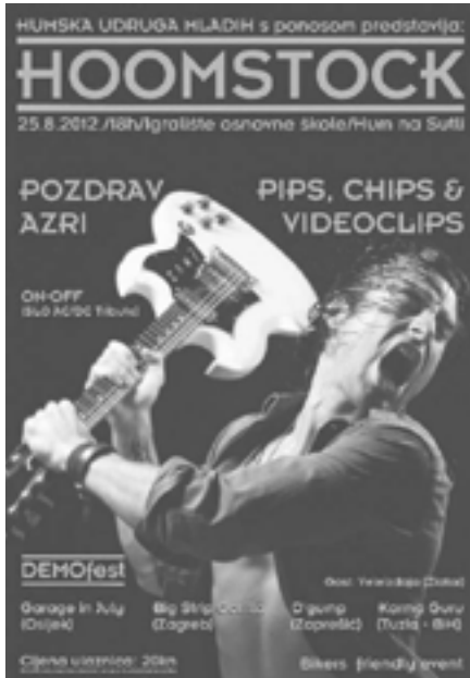
Hoomstock 2012, plakat

Dodijeljena je donacija knjižnici OŠ Viktora Kovačića.