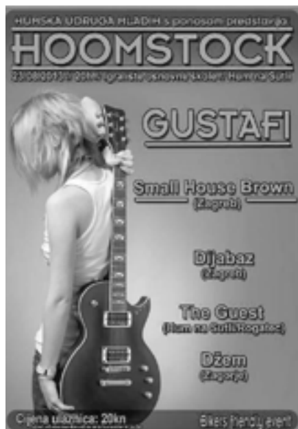
Hoomstock 2013, plakat