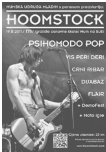
Hoomstock 2011, plakat