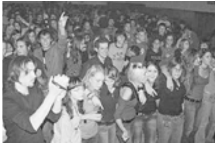
Publika s prvog Hoomstocka

Prve godine nastupili su Retro 69 , Superbake , Delikt , The Humskey , Zadruga i Juci , bilo je stvarno dobro prihvaćeno i sakupilo se preko 400 posjetitelja što je za mali humski kraj bilo iznad svih očekivanja. Ulaznice su iznosile simboličnih 10 kuna, a sakupljale su se donacije za kolegicu koja je nastradala u prometnoj nesreći netom prije samog koncerta i od tog trenutka Hoomstock je postao i humanitarni koncert kojim se pomaže socijalno ugroženim i potrebitim humskoga kraja.