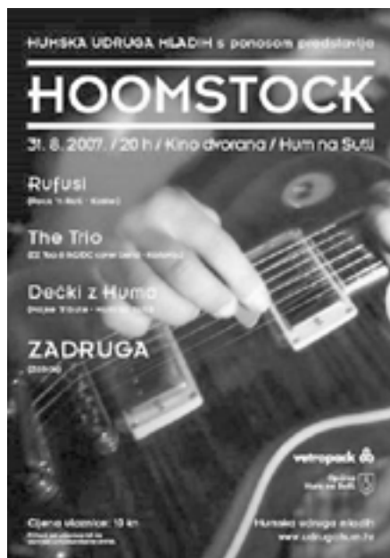
Hoomstock 2007, plakat

Koncert je okupio 600 posjetitelja, a energičnim su nastupima oduševili Zadruga, The Trio, Dečki 'z Huma i Rufusi . Opremljena je računalna učionica za djecu s posebnim potrebama u OŠ Viktora Kovačića. Donirano je 6 poklon bonova vrijednosti od 1500 kn (za odjeću, školski pribor i sl.) djeci iz socijalno najugroženijih obitelji Huma na Sutli.