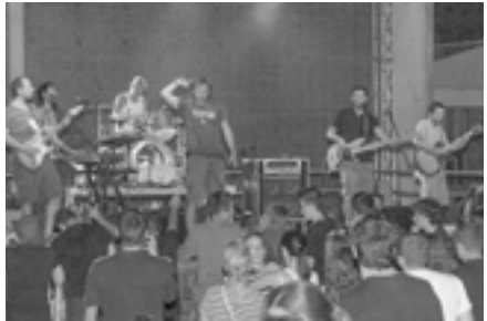
Pips, Chips & Videoclips