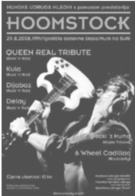
Hoomstock 2008, plakat

Nakon uspjeha kojem se nitko nije nadao, Udruga mladih usudila se krenuti u nepoznato te se susrela s nekim novim problemima i nekim drugim rizicima za razliku od onih tipičnih za organizaciju glazbenog događaja u dvorani.