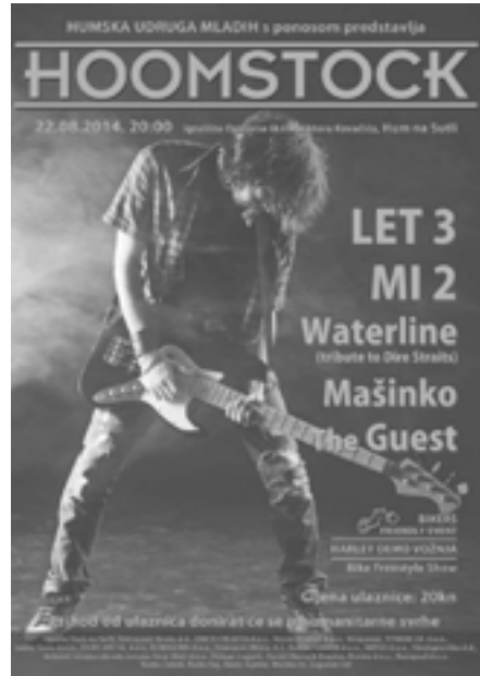
Hoomstock 2014, plakat