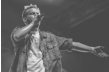
Kandžija i Gole žene

U sklopu festivala bio je organiziran besplatan prijevoz iz Zagreba i Varaždina te besplatan (Hemmens) kamp za sve one koji su došli iz udaljenih krajeva a htjeli su uživati oba dana festivala.