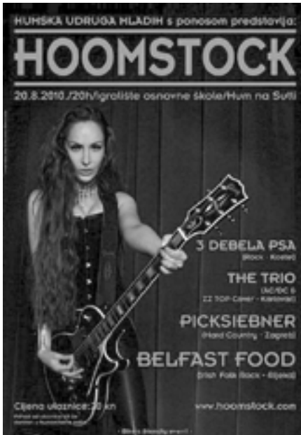
Hoomstock 2010, plakat

Belfast Food, Picksiebneri, The Trio i 3 Debela psa postavili su ljestvicu na neke nove visine što je rezultiralo rekordnim brojem posjetitelja. Hoomstockom '10 donirano je 10 poklon bonova vrijednosti po 1500 kn (za odjeću, školski pribor i sl.) djeci iz socijalno najugroženijih obitelji Huma na Sutli.