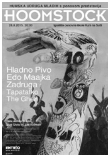
Hoomstock 2015, plakat

Sve je započelo izložbom fotografija pod nazivom Ritam 21. kolovoza u Narodnoj knjižnici Hum na Sutli. Ritam je izložba fotografa Željka Đurine iz Konjšćine koji nastavlja s nizom samostalnih izložba u kojima ritam pokazuje kao svakodnevnu pojavu koja se proteže u svim dijelovima ljudskog postojanja. U nizu fotografija može se istaknuti ritam kao poveznica koja daje smisao. Ravnateljica knjižnice Narcisa Brezinščak nije krila zadovoljstvo ovom suradnjom, dok je predsjednik Foto kluba Krapina Matija Miklaužić istaknuo kako je Željko aktivan član FKRR-a u svim vidovima rada. Također se ukratko osvrnuo na izložbu te izjavio kako su izložene fotografije uvid u svijet koji fotografi svakodnevno viđaju oko sebe. U nastavku programa autor izložbe je i sam ispričao kako su fotografije zapravo nastale. Otvorenje, na kojem se skupilo 30 – ak posjetitelja, popratio je glazbeni duo – Klemen