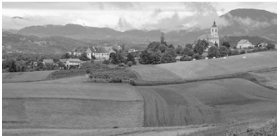
Hum na Sutli

Obrazovna struktura jedna je od najvažnijih značajki stanovništva neke lokalne zajednice, regije ili zemlje. Struktura u kojoj nema nepismenih, a istodobno postoji mnogo stručne radne snage, pogotovo visokoobrazovane, temelj je za dobar gospodarski, kulturni i socijalni razvoj.