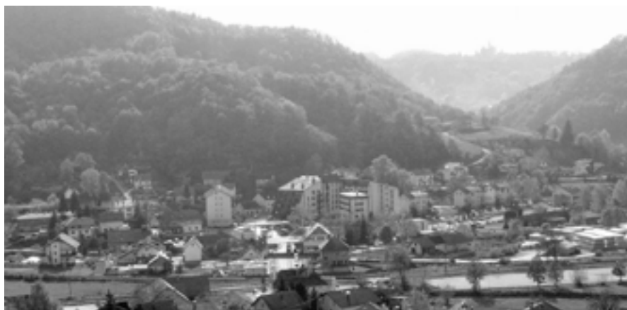
Hum na Sutli,

Krapinsko-zagorska županija smještena je u sjeverozapadnom dijelu Republike Hrvatske. Obuhvaća zapadni dio središnje Hrvatske dok u funkcionalnom smislu pripada području zagrebačke makroregije. Geografski gledano, podudara se s prirodnom regijom Donje Zagorje koje je omeđeno vrhovima Macelja i Ivančice na sjeveru, Medvednicom na jugoistoku, vododijelnicom porječja Krapine i Lonje na istoku te rijekom Sutlom i državnom granicom s Republikom Slovenijom na zapadu.