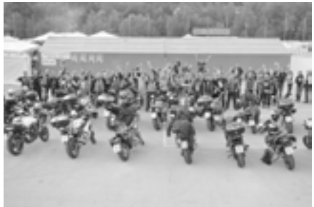
MK Tabor Bajkers